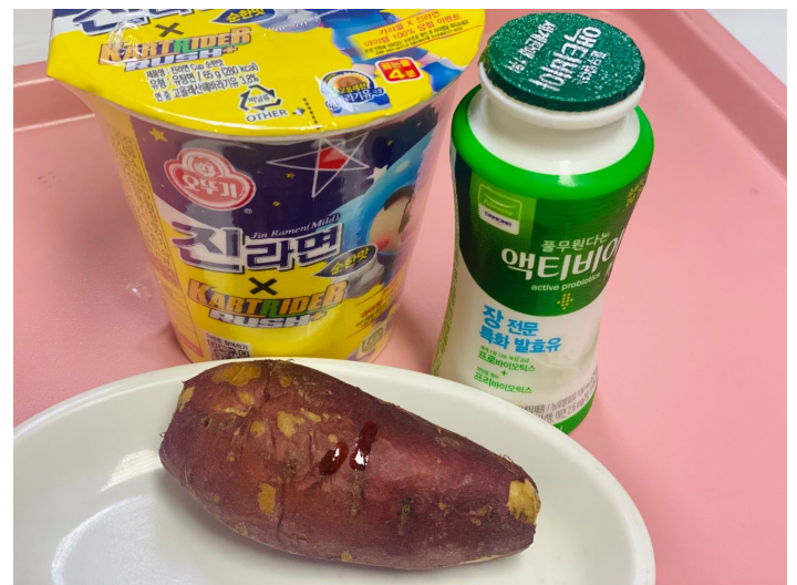
오후 일반) 찐고구마 + 액티비아 또는 선택간식) 진라면 간식 당뇨) 찐고구마 + 액티비아