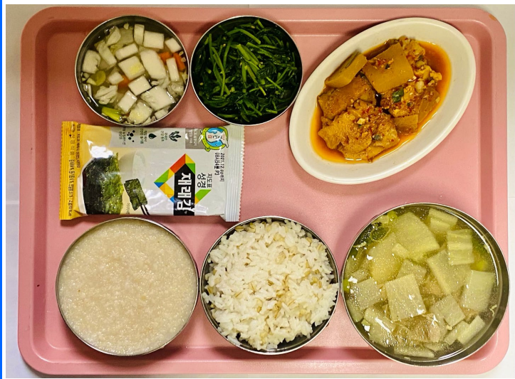
조식 보리밥/누룽지죽 무쇠고기국 코다리양념 참나물 도시락김 백김치/물김치