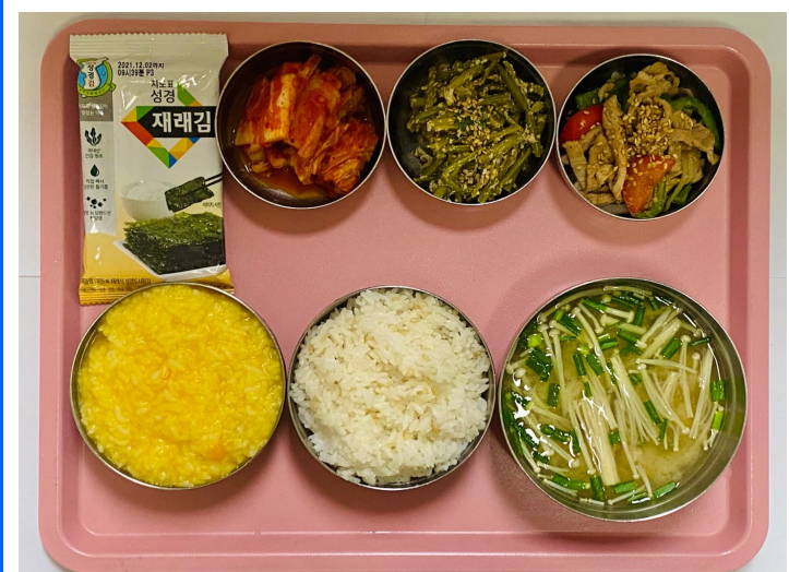
석식 현미밥/단호박죽 팽이유부돼된장국 고추잡채 핫고구마순들깨볶음 도시락김 배추김치