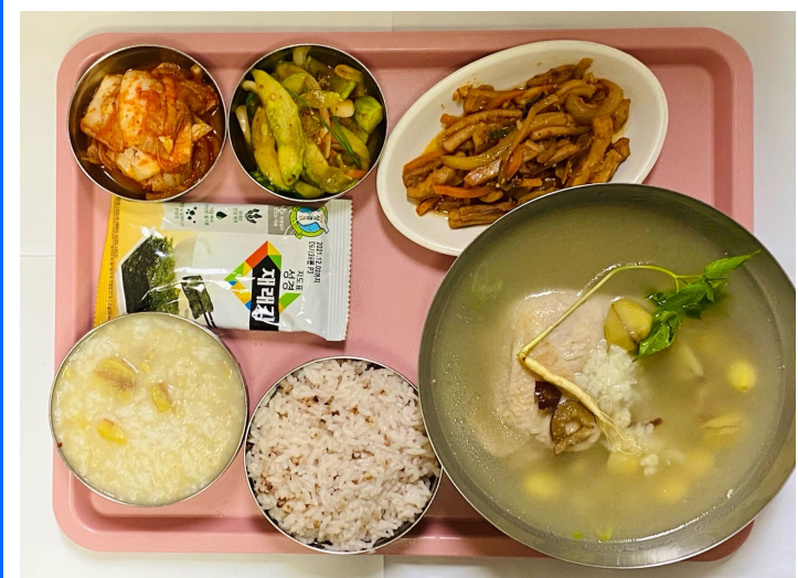
중식 수수밥/밤죽 한방삼계탕 오징어야채볶음 오이부추겉절이 도시락김 배추김치