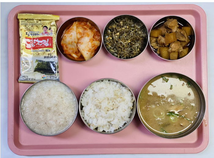
중식 보리밥/버섯죽 버섯들깨탕 매운돈사태찜 잔멸치견과류조림 도시락김 배추김치