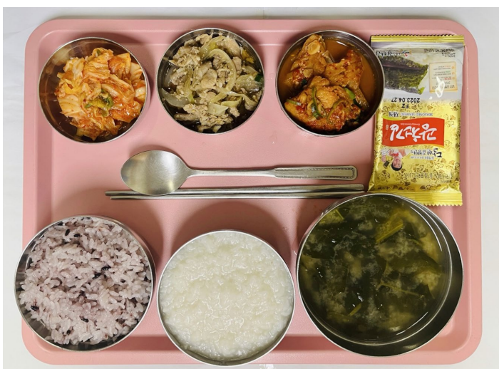
석식 흑미밥/밤죽 시금치국 코다리양념 제육볶음 도시락김 배추김치