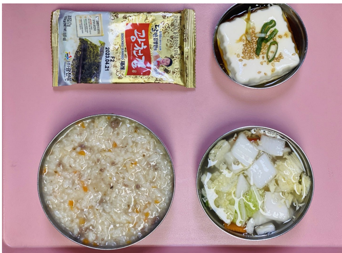
조식 쇠고기자연송이죽 물김치 연두부 도시락김