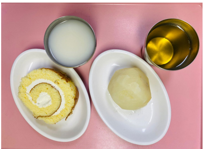
오후 간식 일반 : 롤케익+우유 당뇨 : 찢감자+우유