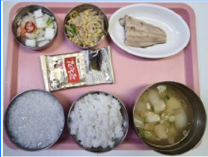
조식 백미밥/흰죽 감자계란국 콩나물무침 도시락김 백나박김치