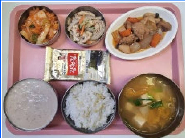
석식 기장밥/호두죽 참치김치찌개 돼지마늘장조림 새송이들깨볶음 도시락김 배추김치