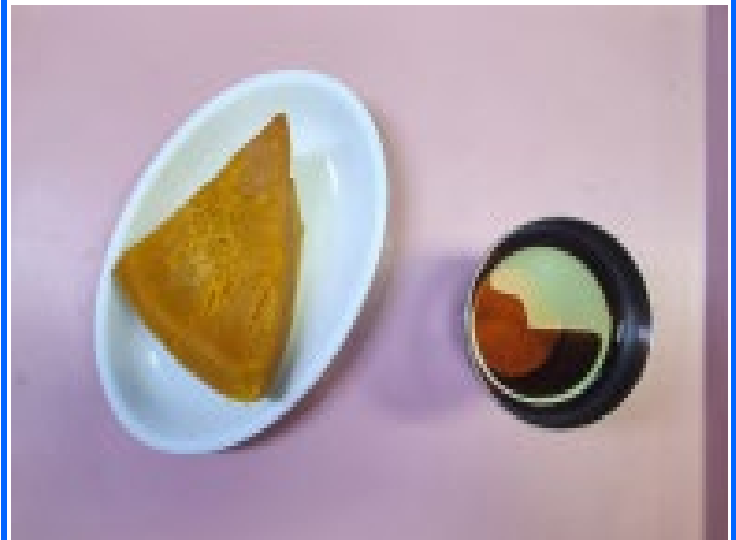
오후 간식 찌단호박+옥수수차