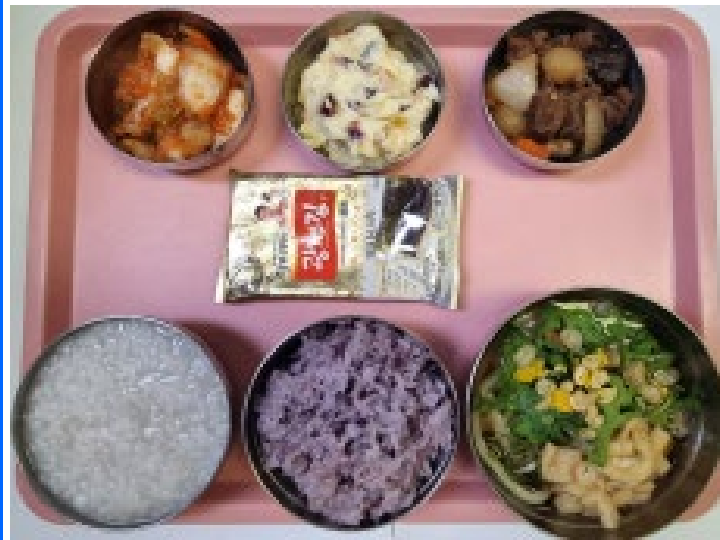
중식 흑미밥/버섯죽 유부우동 소고기표고장조림 감자샐러드 도시락김 배추김치