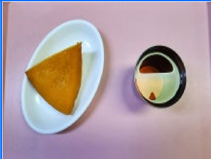
오후 간식 찐단호박+옥수수차