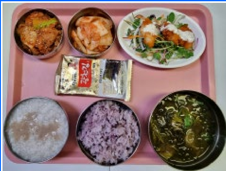
중식 흑미밥/버섯죽 아욱보리새우된장국 제육볶음 아귀가라아게+새싹샐러드 도시락김 배추김치