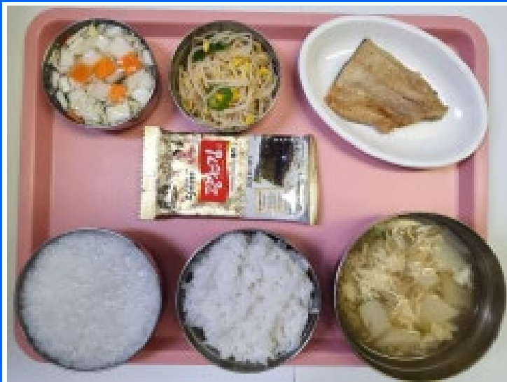
조식 백미밥/흰죽 감자계란국 콩나물무침 도시락김 백나박김치 임연수구이