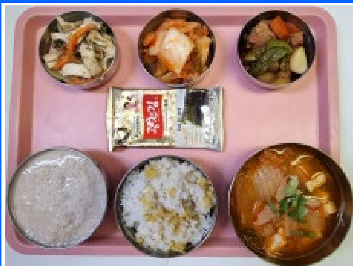
석식 기장밥/호두죽 참치김치찌개 돼지마늘장조림 새송이들깨볶음 도시락김 배추김치