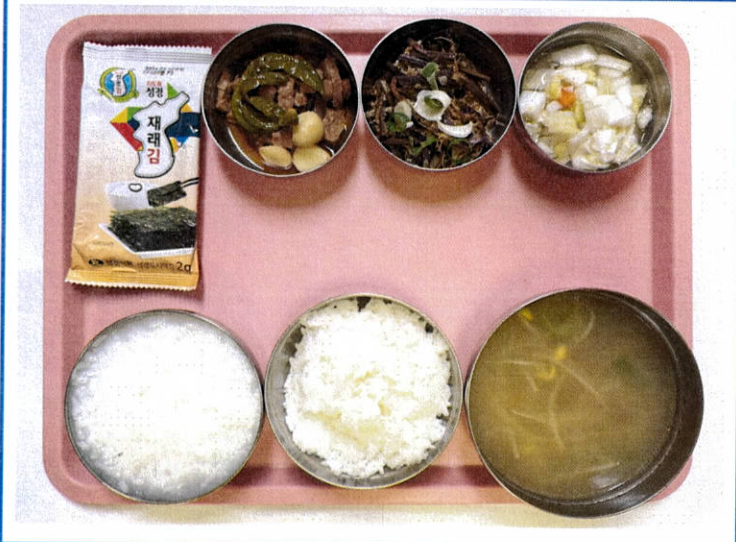
조식 백미밥/흰죽 북어채국 돈장조림 고사리들깨나물 도시락김 물김치