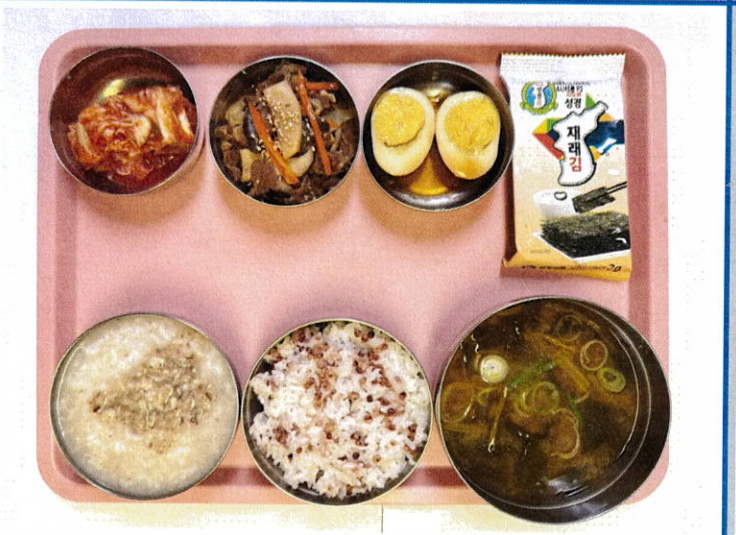
석식 수수밥/버섯죽 시금치국 버섯불고기 계란장조림 도시락김 배추김치