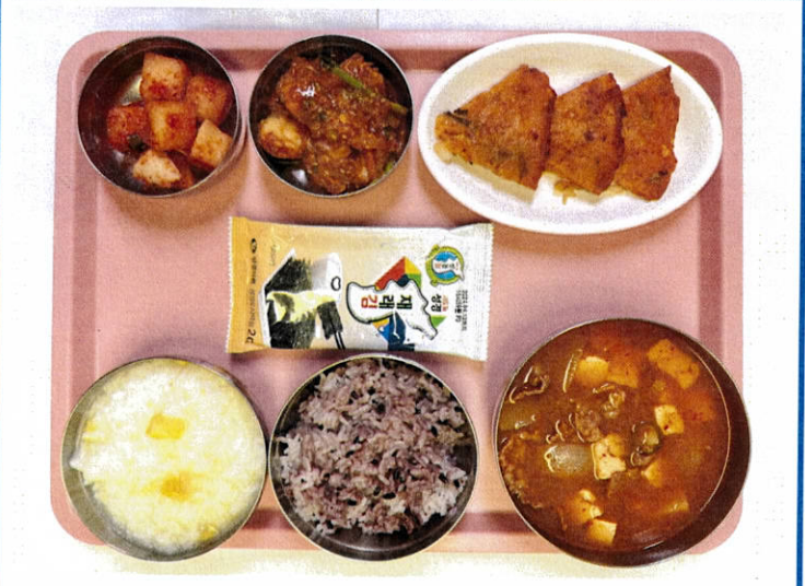
중식 흑미밥/밤죽 차돌박이된장찌개 아귀찜 김치전 도시락김 깍두기