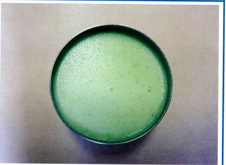
오후 간식 브로콜리스프